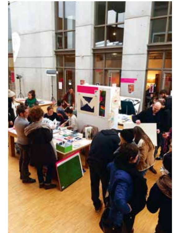
Impressions Multiples #6