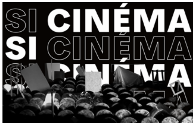
Caduque, Laurent Lacotte, Adagp (except contrary mentions)