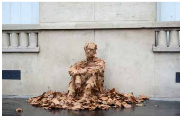
Caduque, Laurent Lacotte, Adagp (except contrary mentions)

Le temps d'une semaine de workshop (du 5 au 9 février), l'artiste plasticien Laurent Lacotte a pour idée de faire prendre conscience aux élèves de la classe préparatoire que la production artistique ne saurait se cantonner aux seules limites physiques de l'atelier, en les amenant à investir de manière sensible les espaces publics de la ville de Cherbourg et notamment l'espace d'exposition du Point du Jour. Les élèves seront ainsi invités à s'infiltrer dans l'exposition de Camille Fallet qui devient le contexte de leur propre exposition, incluant l'artiste lui-même dans ce contexte. Les élèves de la classe prépa présenteront leur travail au public le vendredi 9 février au Point du Jour.