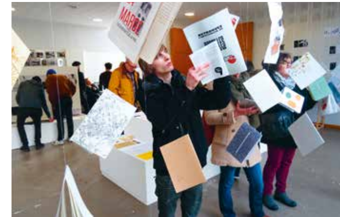
Portes ouvertes 2017

Samedi 10 février de 10h à 18h à Caen et Cherbourg