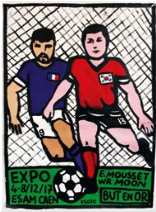
Affiche de l'exposition, dessin de Woorim Moon, feutre promarker, 2017

Exposition de Woorim Moon et Emmanuel Mousset, avec la participation de Cyprien Desrez et Biche Doe