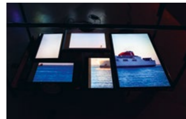
Léo Fourdrinier, Horizon , acier, écrans LCD, 130x80x100 cm, 2015

Exposition de l'association des anciens étudiants de l'ésam Caen/Cherbourg en partenariat avec le Frac Normandie Caen