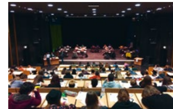
Vue de l'épreuve écrite du concours d'entrée

Attention les modalités du concours changent cette année! Les candidats au concours d'entrée en 1 ère année d'études peuvent s'inscrire en ligne du 15 janvier au 9 mars 2018. Ils seront ensuite convoqués aux épreuves d'admission du 27 au 29 mars. Retrouvez le calendrier des inscriptions sur www.esam-c2.fr/admission et venez nous rencontrer le samedi 10 février lors de la journée Portes Ouvertes à Caen et Cherbourg.