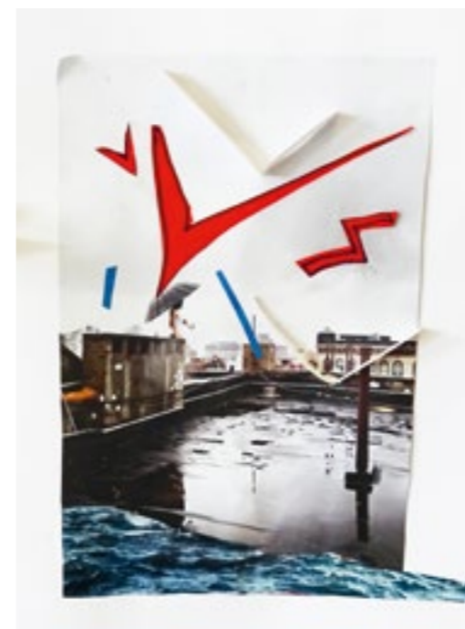
Travail réalisé par Arsène présenté dans le cadre de l'exposition L'art de la vie

→ Vernissage jeudi 7 décembre de 14h30 à 17h ésam Caen/Cherbourg, bâtiment A, 3 e étage, site de Caen – Entrée libre