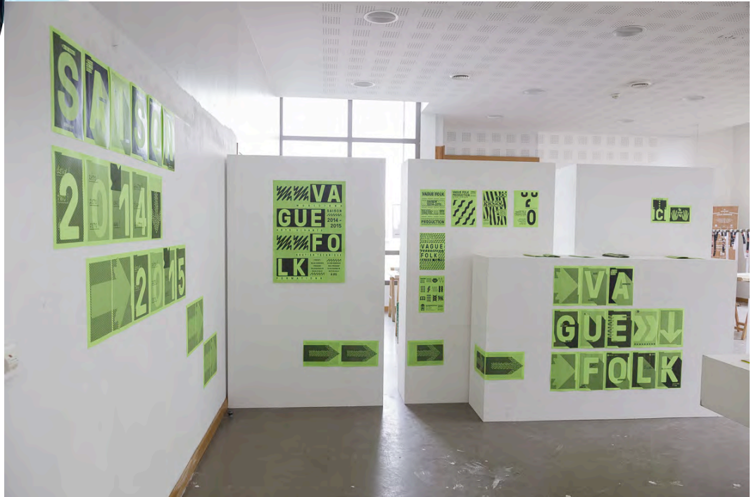
Robin Defilhes, campagne d'information