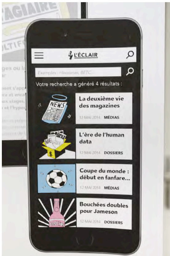
Léa Hadjadj, multimédia, photo : Michèle Gottstein

site de Caen (siège social) 17, cours Caffarelli 14000 Caen • site de Cherbourg 61, rue de l'Abbaye 50100 Cherbourg-Octeville téléphone: +33.(0)2.14.37.25.00 • fax: +33.(0)2.14.37.25.01 • courriel: info@esam-c2.fr • site web: www.esam-c2.fr