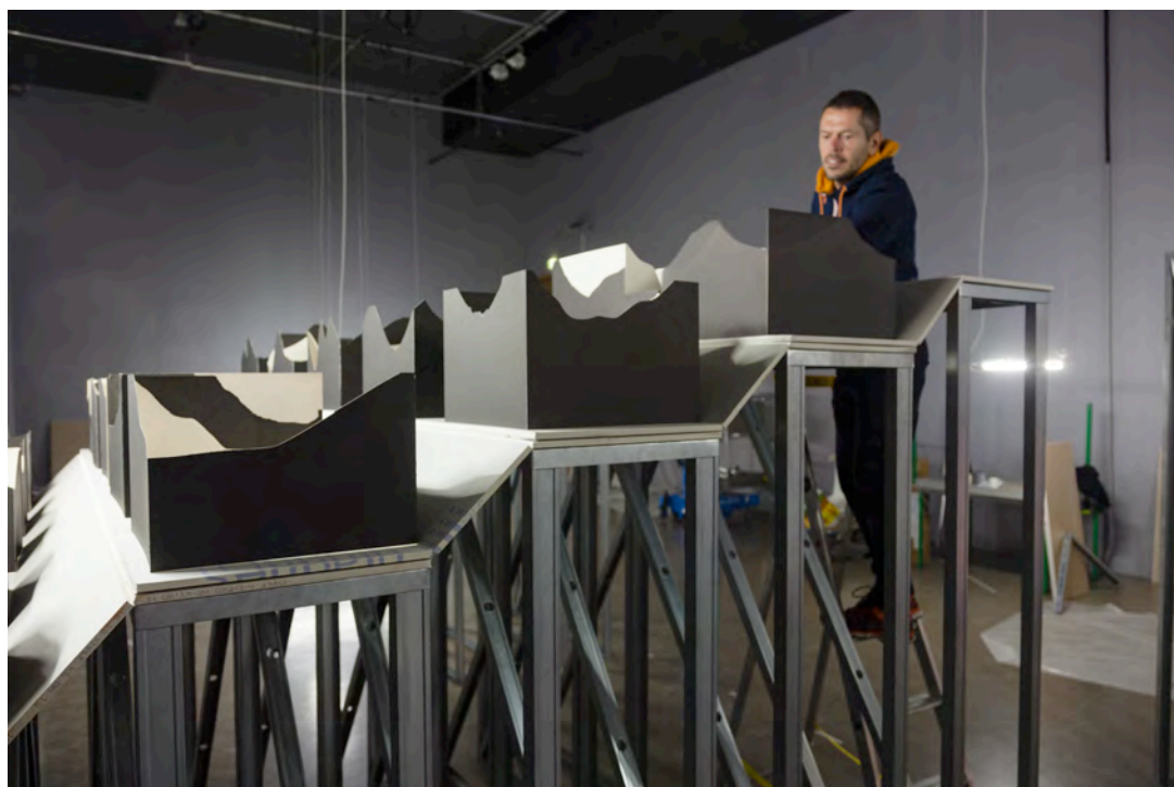
Vues du montage de l'exposition Gefrorene Tränen , ésam Caen/Cherbourg – site de Caen, octobre 2015