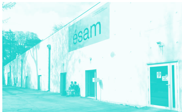
Bâtiment E : secrétariat Grand public et ateliers adultes céramique et sculpture