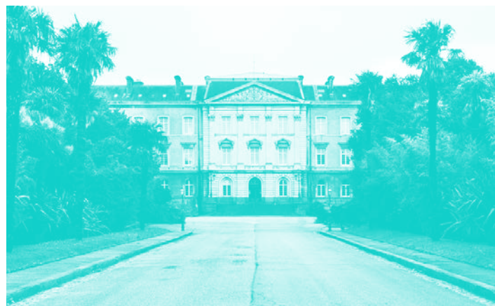
Bâtiment A : ateliers jeune public et ateliers adultes dessin et peinture. L'entrée dans les ateliers s'effectue par l'arrière du bâtiment, Rue Basse.