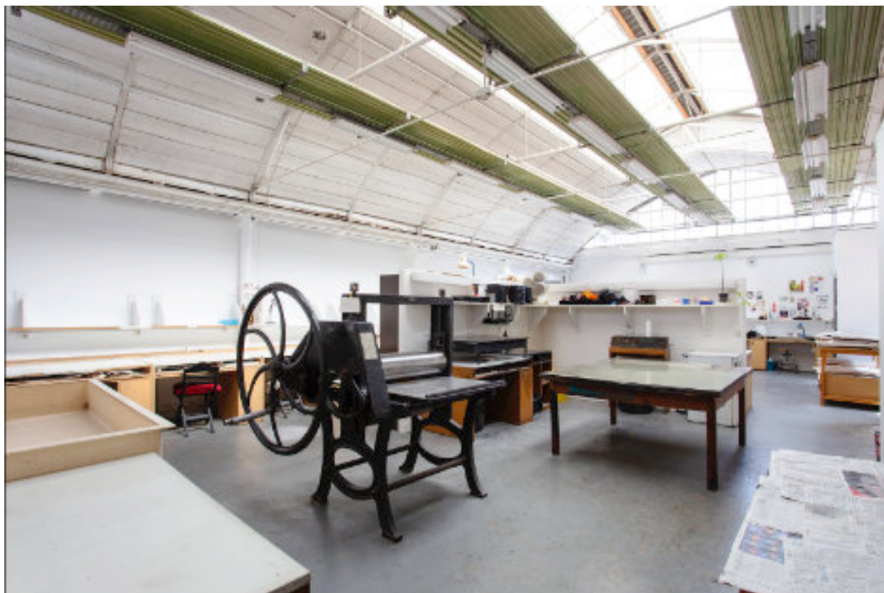
Vue de l'atelier gravure de la Cité internationale des Arts

À partir de janvier 2022, la Cité internationale des Arts accueillera chaque année un-e ou deux diplômé-es de l'ésam Caen/Cherbourg pour une durée de trois mois. L'artiste sélectionné-e bénéficiera d'un atelier-logement situé dans le quartier du Marais, à Paris, ainsi que d'un accompagnement individualisé assuré par l'équipe de la Cité internationale des Arts tout au long de son séjour. Il-elle touchera également une bourse de vie (750€ par mois) et une bourse de production (750€).