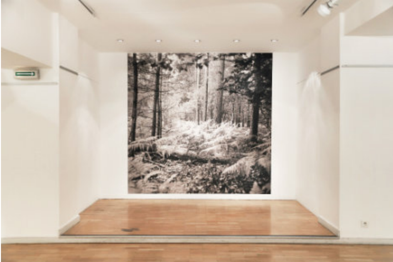
Vue de l'exposition de fin de résidence de Mélissa Mérinos à Prague, «50°32'07.1"N14°48'01.9"E», galerie de l'Institut Français, novembre 2019

Depuis 2018, un.e diplômé.e de l'ésam Caen/Cherbourg bénéficie chaque année d'une résidence de création à Prague, en République Tchèque, de juillet à septembre. L'artiste sélectionné.e y dispose d'une bourse de production et de mobilité (1000€), d'une bourse de rémunération (1600€), d'un logement à Bubahof et d'un atelier de travail au centre d'art MeetFactory.