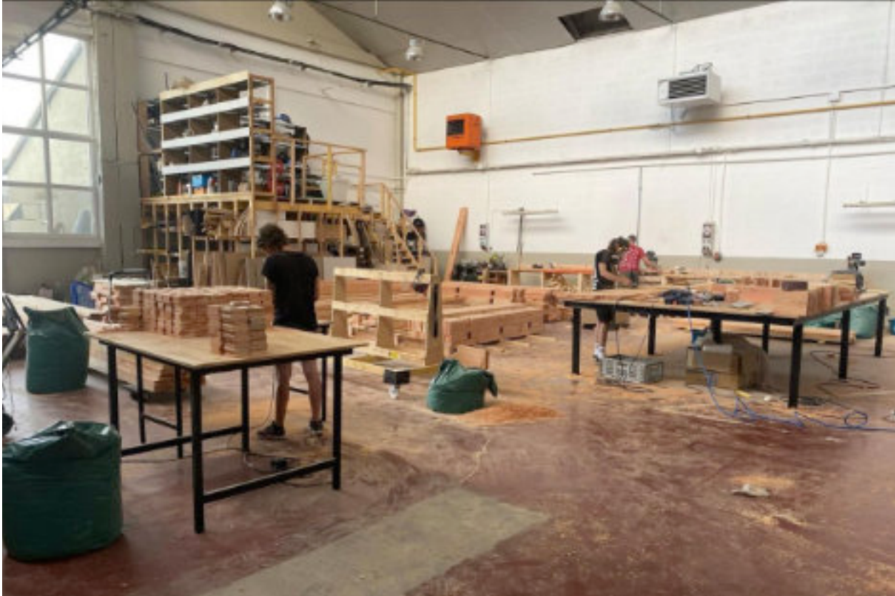
Vue de l'atelier du collectif Manœuvre, Bretteville-sur-Odon

Depuis septembre 2020, le collectif Manœuvre, composé d'artistes issues de l'ésam Caen/Cherbourg, accueille pour une période de 12 mois deux jeunes diplômé·es de l'école dans son atelier de 630m 2 , au sein de l'ancienne caserne König à Bretteville-sur-Odon. Ces dernier·ères y ont accès à l'ensemble des espaces pour leur création plastique et participent à la vie matérielle et associative de Manœuvre.