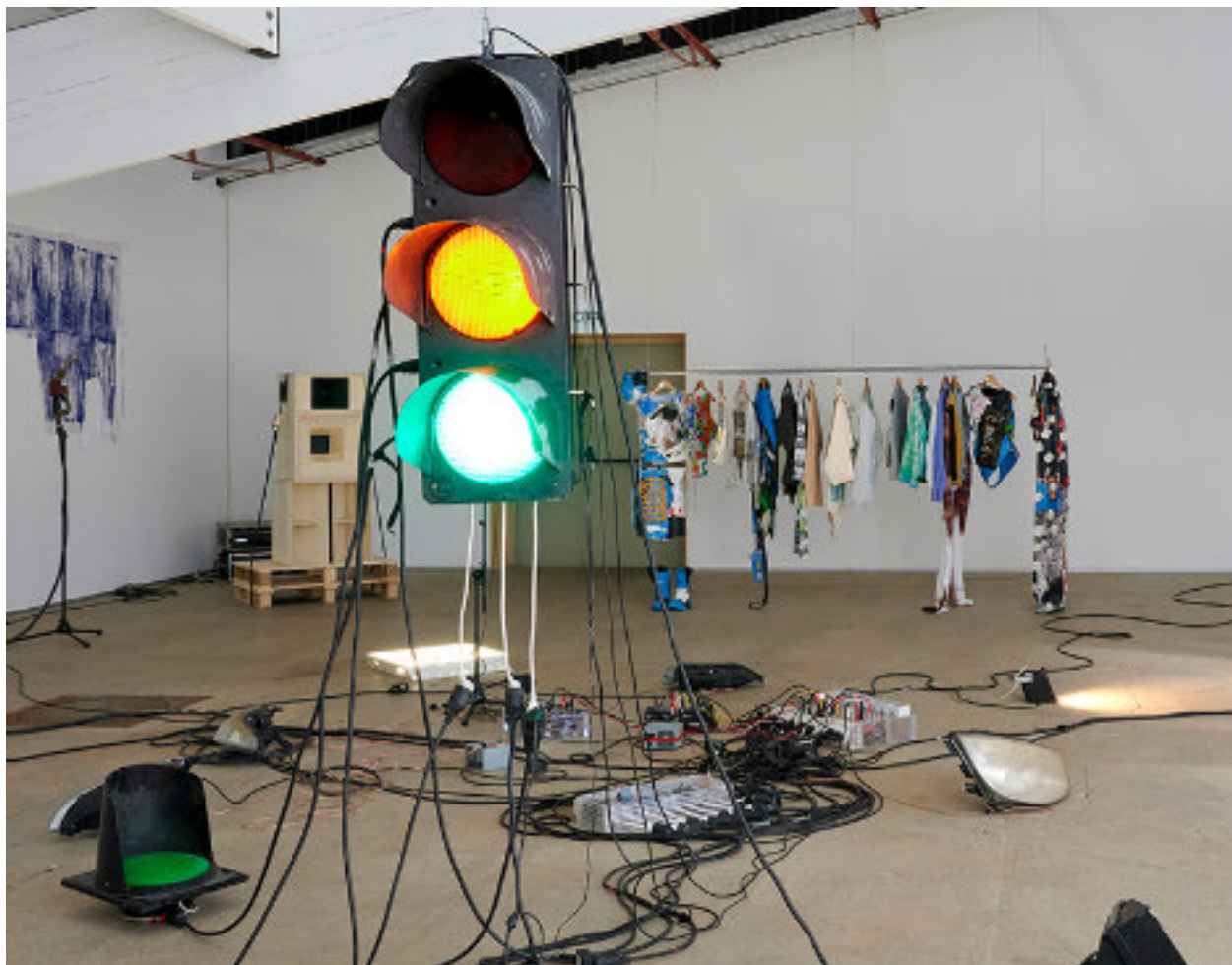
Arthur Belhomme et Victor Bureau, vue de l'exposition « Demain, y'a carrière », Confort moderne, Poitiers, juillet 2021

Depuis 2018, le centre d'art Le Confort moderne accueille chaque année deux diplômé-es de l'ésam Caen/Cherbourg pour une période de quatre à cinq mois. Lors de cette résidence, les artistes sélectionné-es disposent d'un atelier de travail, d'un logement, d'une bourse de rémunération (2500€), d'une bourse de production et de mobilité (1500€) et de rendez-vous réguliers avec les curateurs, curatrices et les artistes invité-e-s au Confort moderne.