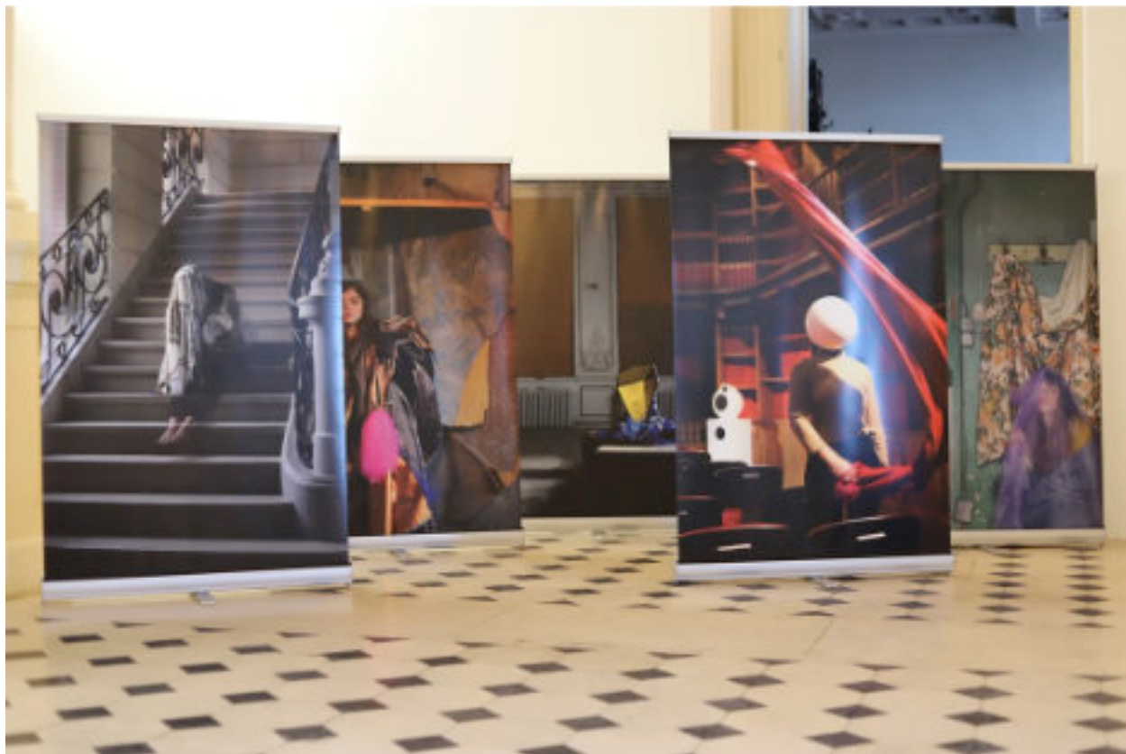
Lou Parisot, «Huiles sur Enrouleurs», 5 photographies sur roll-up, vue de l'exposition «Douce Bigarreries», Musée de Louviers, février 2020

Depuis 2016, l'ésam Caen/Cherbourg est partenaire des résidences d'artistes mises en place à la Villa Calderon par la Ville de Louviers, avec le soutien de la Région Normandie et du Département de l'Eure . Ainsi, chaque année, trois jeunes artistes diplômé-es de l'ésam Caen/Cherbourg et de l'ESADHaR bénéficient pendant quatre mois d'un hébergement, d'un atelier, d'une bourse de rémunération (900€ par mois) et d'une bourse de production (1200€). Une exposition au Musée de Louviers, accompagnée d'une publication, vient clore les résidences.