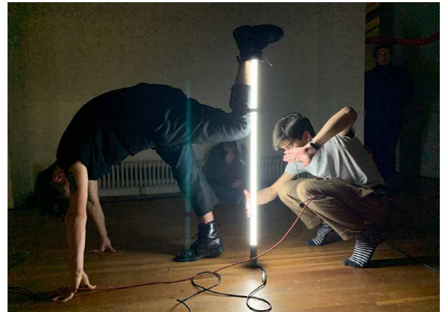
Workshop «Haye Haye» à l'ArtScience Interfaculty, Royal Academy of Art, La Haye, Pays-Bas, novembre 2019