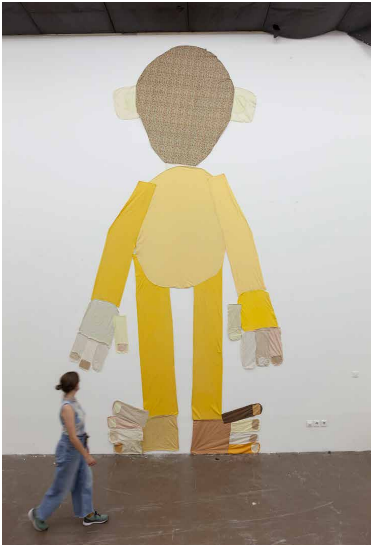
Laura Rodríguez, soutenance plastique du DNSEP option Art, juin 2022