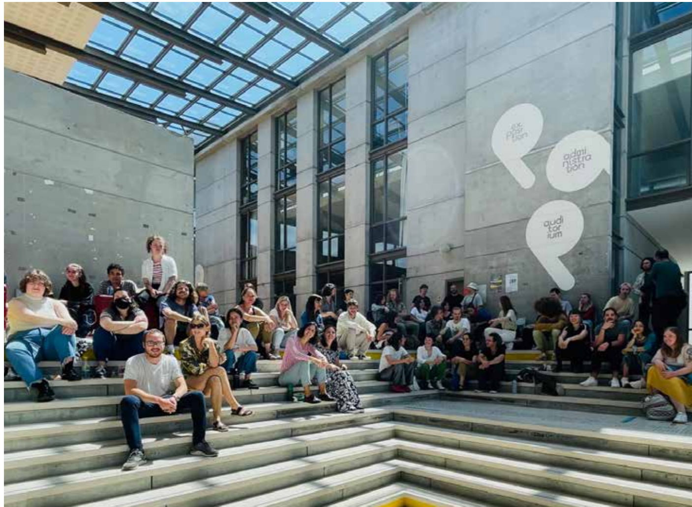
Résultats du DNSEP option Art, juin 2022