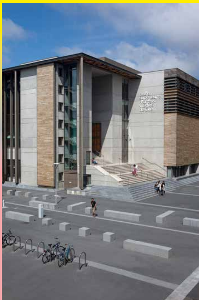
Site de Caen de l'esam

Julie Laisney, Directrice de la communication & du développement culturel 02 14 37 25 15 / 06 08 63 79 28 j.laisney@esam-c2.fr