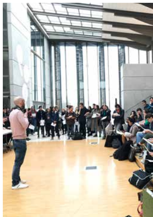
Concours d'entrée 2018, début de l'épreuve pratique

Les inscriptions à la 1 ère session 2019 du concours d'entrée, des commissions d'admission en cours de cursus et d'admission en classe préparatoire seront ouvertes à partir du 14 janvier sur le site internet de l'ésam Caen/Cherbourg : www.esam-c2.fr