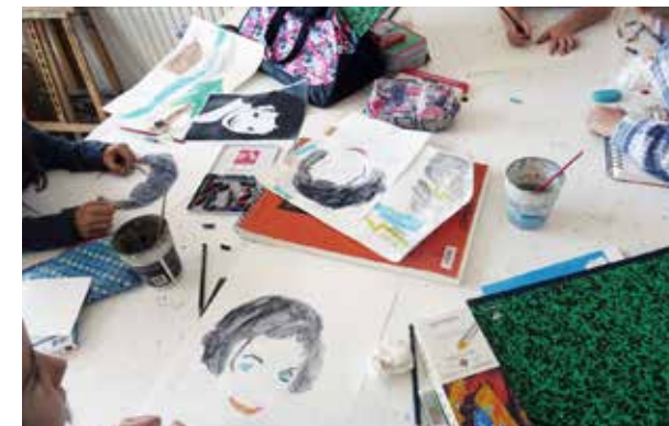
Atelier 8-10 ans, Veronique Delange

– Costumes et masques, pour les enfants et les adultes, avec Marion Dubois Du lundi 18 au vendredi 22 février de 13h30 à 17h30, à Cherbourg / Tarifs : 70 € pour les enfants et 90€ pour les adultes – inscription jusqu'au 8 février Les masques et costumes ont influencé et inspiré de nombreux artistes. Il s'agira lors de ce stage, ouvert à des binômes adulte/enfant (à partir de 6 ans) ainsi qu'à des enfants seuls (de 9 à 14 ans), de créer à son tour un costume à partir de matériaux de récupération.