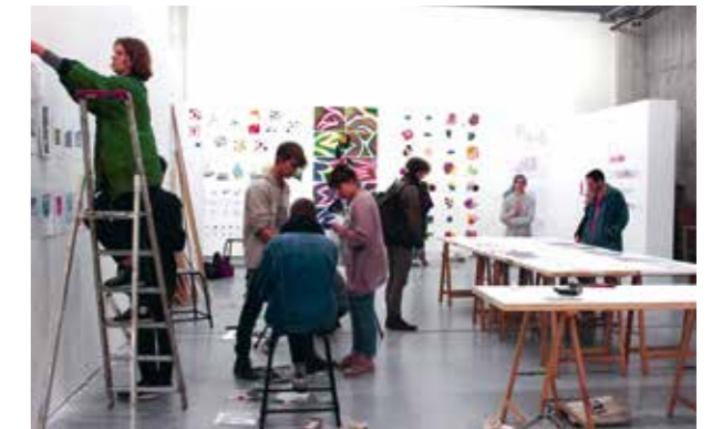
Atelier de la classe préparatoire 2017-2018