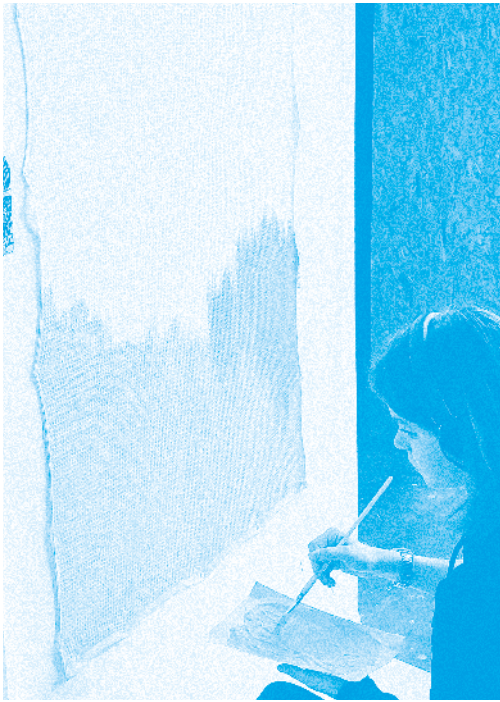
Workshop « Making of », Caen, septembre 2019 / Photo: A. Linger

Le schéma des études, les grilles de crédits ECTS et les emplois du temps sont consultables en ligne : www.esam-c2.fr/livret/etudes . Il est également possible de suivre en images les workshops, les accrochages de diplômes, les productions personnelles des étudiantes, etc. sur les réseaux sociaux : facebook.com/EsamCaenCh , twitter.com/esamCaenCh , instagram.com/esamcaench , flickr.com/esamCaenCherbourg