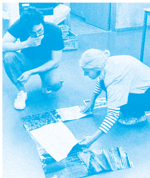
Workshop «All Print», Caen, septembre 2019

— le second cycle, d'une durée de deux années supplémentaires, est essentiellement consacré à la préparation du DNSEP. À l'entrée en quatrième année, les étudiantes choisissent l'une des deux mentions de l'option Art (mention Art ou mention Cherbourg) ou bien l'option Design mention Éditions. Lors de cette même année, elles ont la possibilité d'effectuer un séjour d'études dans l'un des 30 établissements européens et extra-européens partenaires de l'ésam Caen/Cherbourg. Les étudiantes développent leur pratique personnelle, tout en continuant à se voir proposer des cours et ateliers, et en menant une réflexion en dialogue avec leur travail, à travers leur mémoire, comme une réflexion collective à travers l'organisation de séminaires d'initiation à la recherche.