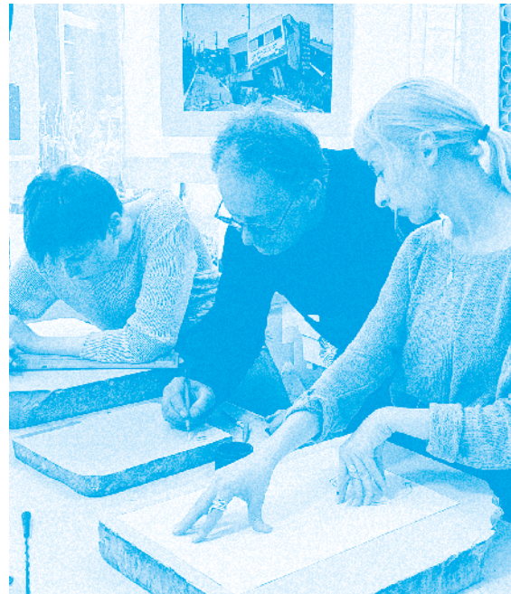
Workshop « Type (Writter) », Caen, septembre 2019

Enfin, les étudiantes disposent au sein de l'école d'ateliers dédiés à leurs activités et travaux personnels, accessibles du lundi au jeudi de 8h30 à 22h (jusqu'à 20h le vendredi). Elles peuvent fréquenter toute la semaine les bibliothèques situées sur chacun des deux sites et assister au sein-même de l'école à des conférences, rencontres avec des artistes, expositions, spectacles, concerts, etc. Ces événements, étroitement liés aux pratiques pédagogiques, sont souvent présentés en partenariat avec le riche réseau des partenaires culturels de l'école.